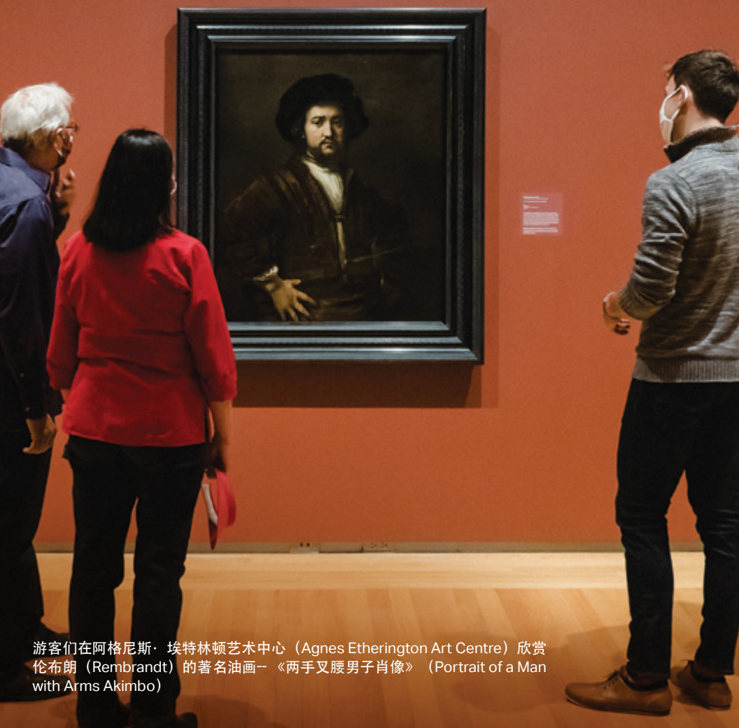
游客们在阿格尼斯·埃特林顿艺术中心（Agnes Etherington Art Centre）欣赏伦布朗（Rembrandt）的著名油画——《两手叉腰男子肖像》（Portrait of a Man with Arms Akimbo）

这里典藏着四幅令人叹为观止的伦勃朗大师著名油画，汇集了两个耳熟能详的电影节，坐拥加拿大最前沿的现场音乐平台，享有生机盎然的市中心购物胜地，以及安省最斑斓的农贸市场。漫步在熙熙攘攘适于步行的市心中，感受着叙述古老故事的城中小道、古朴雅致的古董市场、风情各异的餐馆露台、百花争艳的商铺、目不暇接的博物馆、弥足珍贵的历史遗迹…这里每一个角落都牵动着旅人们驿动的心，是加拿大历史沧桑与现代精致完美结合的妖娆历史之城！