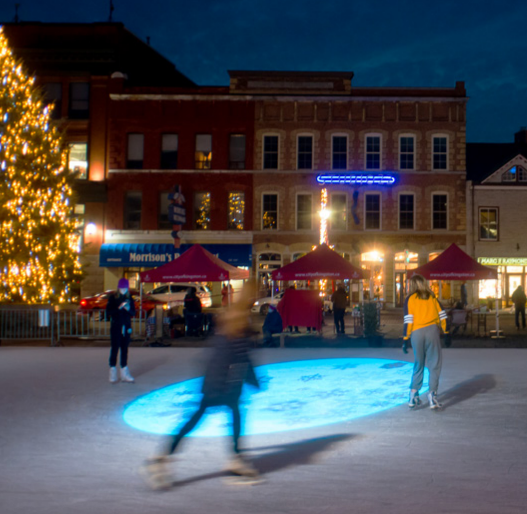
斯普林格集市广场（Springer Market Square）冬日免费溜冰

金斯顿的冬季，像是一幅黑白素描，线条简单，却蕴含丰富！当夜幕降临，华灯初上，金斯顿市中心的热闹才刚刚开始：大大小小的彩灯一一点亮；橱窗里精美的物品让人眼花缭乱、流连忘返；叮当作响的草垛马车行走在街道，仿佛回到了旧时的金斯顿。带着您的冰鞋来市政厅后面的斯普林格集市广场（Springer Market Square）溜冰吧，绚丽的灯光、舞动的音乐，感受冬季夜晚的浪漫！待到天明，城市周围又可尽情享受冬日活动带来的乐趣：越野滑雪、雪地鞋踩雪、冰上垂钓、滑雪橇…金斯顿人民深爱着这里的冬季！