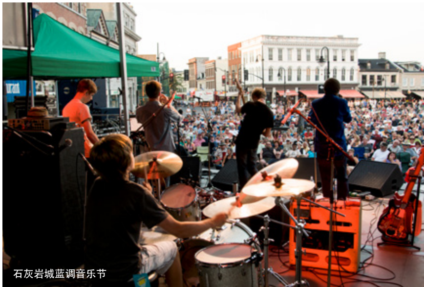
石灰岩城蓝调音乐节

探索更多金斯顿节庆，这里节庆形式丰富多彩，从现场演奏到舞蹈，从绘画艺术到剧院表演。