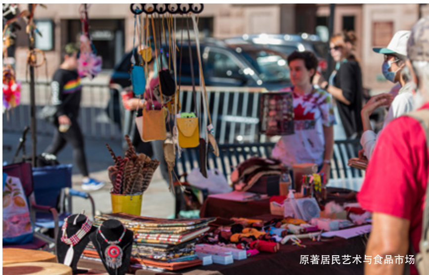
原著居民艺术与食品市场